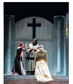
Una scena della "Mandragola"

POSTIGNANO - La chiesa della Santissima Annunziata di Postignano domani alle 18.30 la "Mandragola" di Niccolò Machiavelli con la regia di Claudio Pesaresi; l'ingresso è gratuito. Capolavoro della commedia rinascimentale, la Mandragola ruota intorno alla