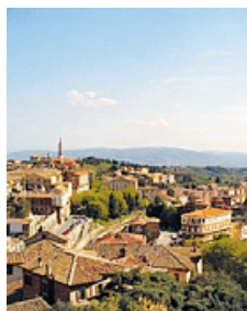
Una veduta panoramica di Perugia

PERUGIA - L'Umbria vista dall'alto sarà protagonista dell'appuntamento che Meravigliarti in Umbria suggerisce al suo pubblico domenica alle 10, con appuntamento all'ingresso di palazzo Baldeschi a Perugia. Una guida di eccezione accompagnerà i visitatori lungo