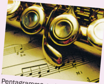
Pentagramma e strumento

TODI - Si concluderà domenica la stagione concertistica "Note d'estate" con il concerto dei migliori diplomati del conservatorio di musica "Francesco Morlacchi" di Perugia. L'appuntamento è alle 18 nella sala delle Bandiere del Palazzo del Vignola di Todi.