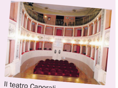
Il teatro Caporali

PANICALE - Il teatro Caporali di Panicale aprirà le porte per far conoscere il mondo della recitazione. La "Compagnia del Sole" ha organizzato per domani alle 17 un "open day" per presentare i nuovi corsi di teatro, recitazione e improvvisazione a cui si darà il via nelle prossime settimane. I corsi sono rivolti a partecipanti dai 6 anni in su.