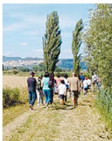
Passeggiata tra la campagna

PERUGIA - Appuntamento domani alle 15.30 per una delle passeggiate della formica Selma. L'appuntamento è al parcheggio di Montebello (Perugia) che si trova tra il bar e l'hotel Tirenus per andare in giro tra gli olivi delle dolci colline di questa parte della città di Perugia.