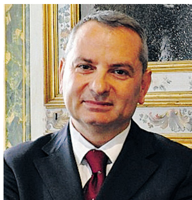
Assessore regionale Fabio Paparelli

ganizzazione e il riordino del sistema regionale hanno l'obiettivo di arrivare alla condizione "un ente, una funzione, una risorsa", in cui ogni procedimento amministrativo inizia e finisce nello stesso ente. Entro un mese dall'approvazione si dovrà procedere alla riallocazione delle funzioni, in parte alla Regione e altre da assegnare in conseguenza dell'approvazione del "jobs act". Turismo e politiche sociali spetteranno ai Comuni in forma associata. Alle Province resteranno competenze in materia di viabilità regionale, trasporti e lago Trasimeno».